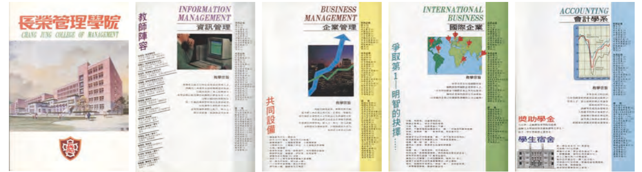
長榮管理學院首屆招生簡章