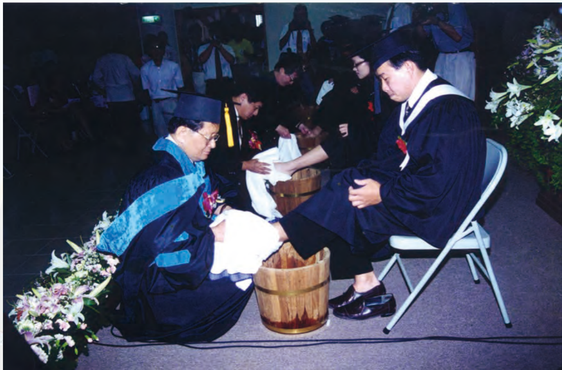
長榮管理學院第一屆畢業典禮—洗腳禮