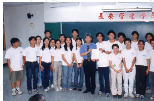
2001.4.2 校長與服務教育的小組長合影紀念