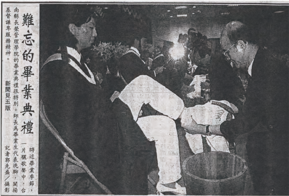
難忘的畢業典禮 時近畢業季節，南縣長榮管理學院的畢業典禮很特別。師長為畢業生代表洗腳，闡揚基督謙卑服務精神。新聞見五版