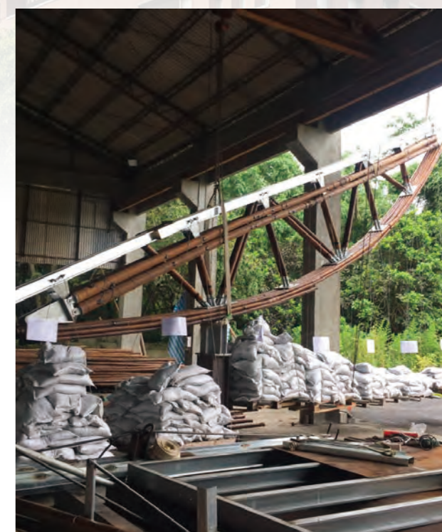
試驗照片-第二次試驗，竹桁架負重至五噸時

一共二十四架長度十二米的竹桁架、二十四組的屋面板皆是在工廠內預製，然後運送到現場吊