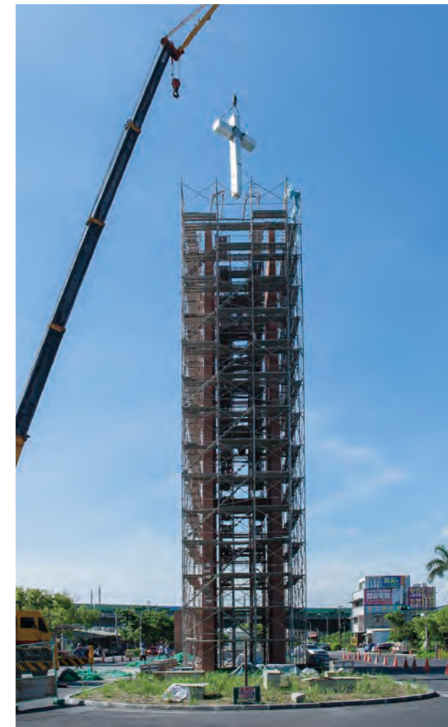
2016.6.6進行新校門的十字架吊掛工程