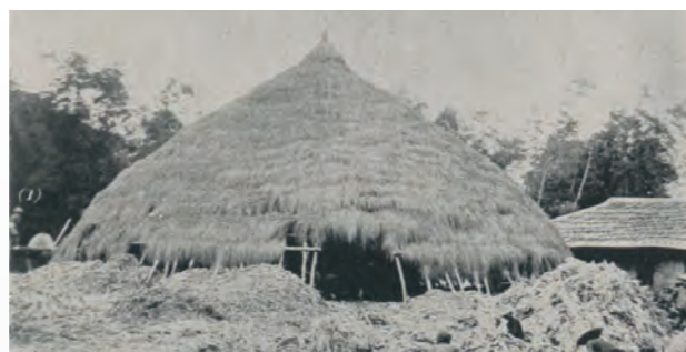
舊式糖廊（赤糖）全景